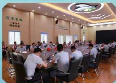
强化督导检查 筑牢安全屏障